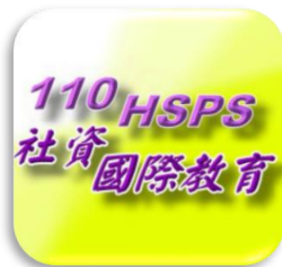
社會資訊之國際教育 11位