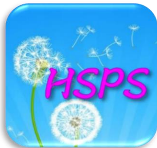
科技化學習扶助蒲公英 8位